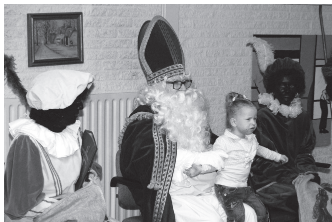
Ook in de Vrijbuiters was een groot Sinterklaasfeest met soms een beetje angstige kinderen.