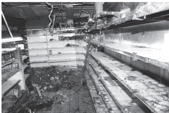
Bij supermarkt Günaydin was brand. Het is nog niet zeker wanneer de winkel weer open gaat.

Sinds een week of wat is het toch al heel gevarieerde winkelaanbod aan de Willemsweg verrijkt met twee nieuwe vestigingen: praktijk Het Aalsterveld (onder meer fysiotherapie en psychologie) en Marokkaans eethuis De Tajine. Minder goed nieuws: de supermarkt Günaydin is na de brand van afgelopen herfst nog steeds gesloten.