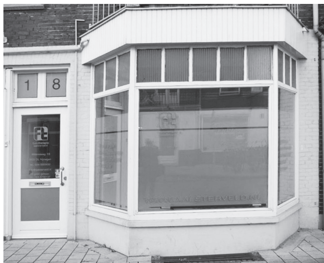
Een opvallende nieuwkomer fysiotherapie praktijk het Aalsterveld

Met De Tajine heeft de Willemsweg er een aanwinst bij. En niet alleen de Willemsweg. Want de Tajine