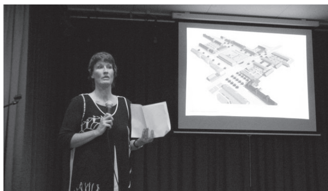
Mevrouw van der Pluym van architectenbureau SPRING presenteert haar ontwerp.

Op de plaatjes zie je de kant van de Willemsweg en een tekening vanaf boven gemaakt.