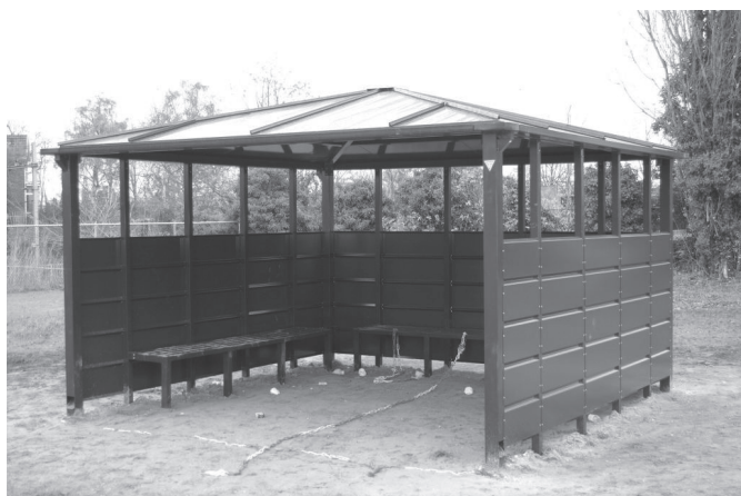
Op de nieuwe voetbalplek voor jongeren op het Hermes-terrein is een JOP geplaatst. Om te hangen dus. En tegen de regen.