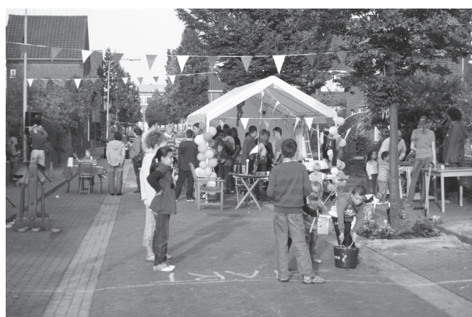
Er zijn talloze straatfeesten geweest afgelopen jaar. Dit is een foto van het feestje in de Zichtstraat op 20 september in de Landbouwboulevard.